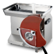
Optional Format M