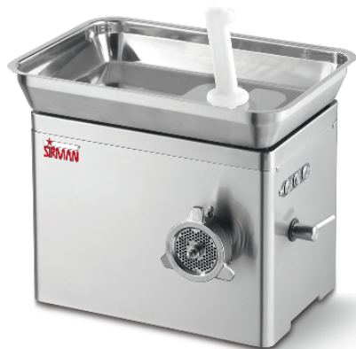
Sirman Мясорубки , model TC 22 Nevada :

Sirman Spa Viale dell'Industria 9/11 35010 PIEVE DI CURTAROLO (PD), Italy Tel./Fax. +39 049 9698666 / +39 049 9698688 email: info@sirman.com