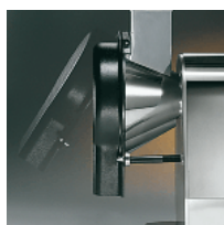
ABS guard with micromagnet on disc holder opening