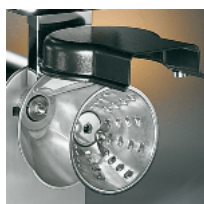
Removable grating discs