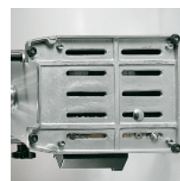
Underside motor protection plate